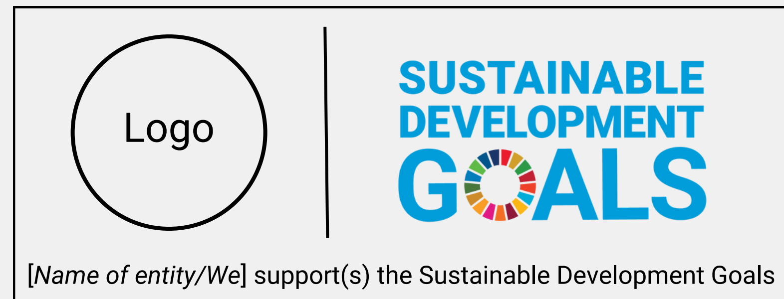
Esimerkki, miten käyttää SDG-logoa yhdessä oman logon kanssa.