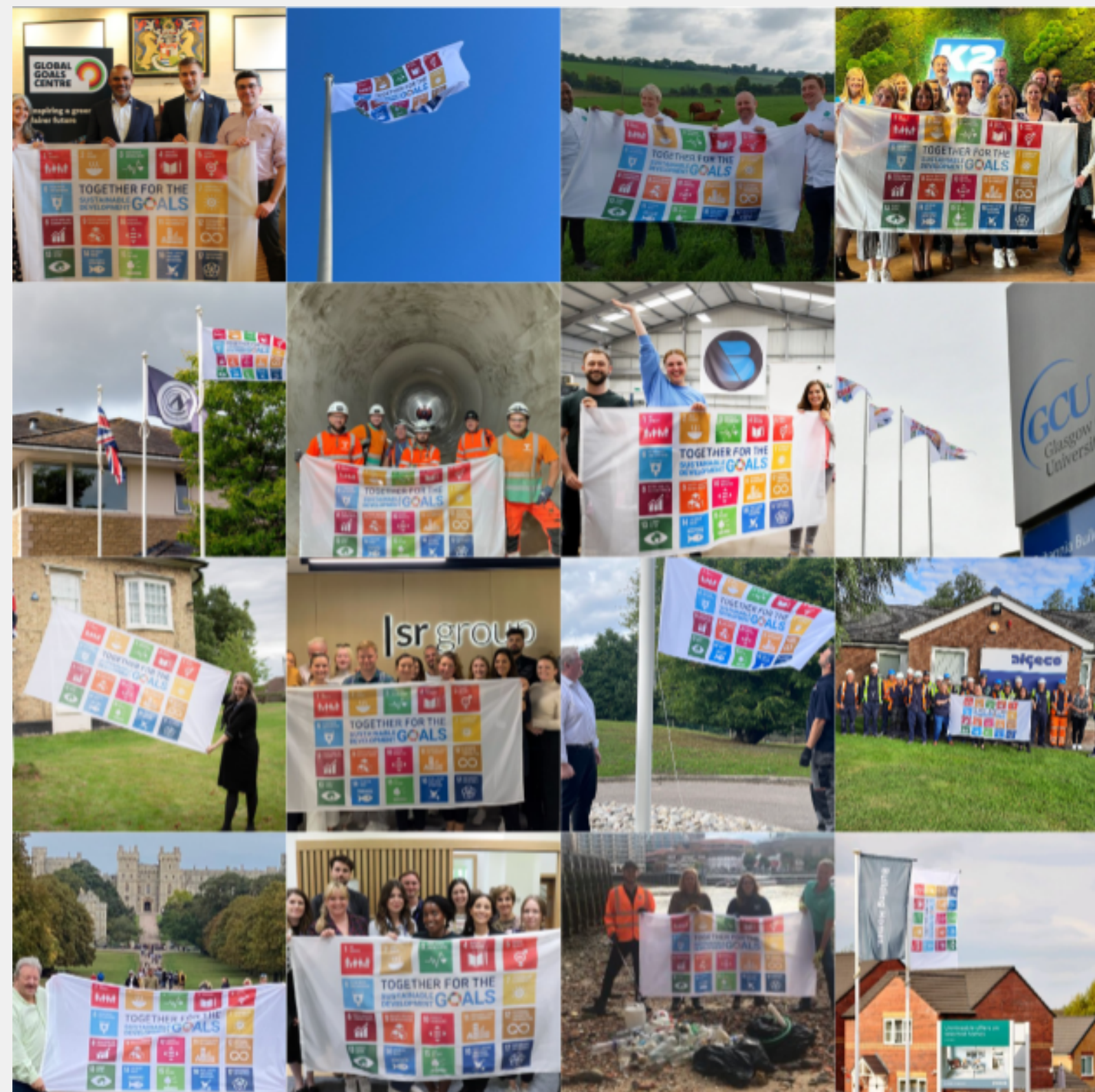
Vuoden 2022 SDG-liputuskampanjaan osallistujien ottamia kuvia.

Pääset lataamaan kaikki kuvat ja logot tästä .