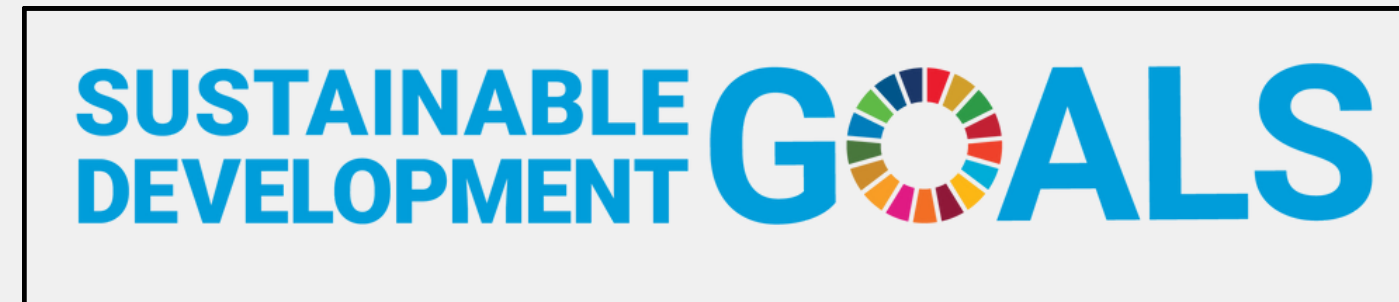
SDG-logo ilman YK-tunnusta